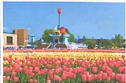
砺波チューリップ公園