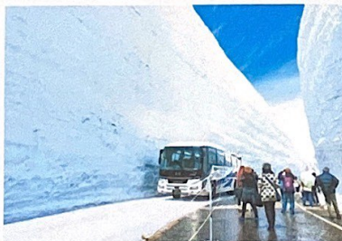
黒部アルペンルート